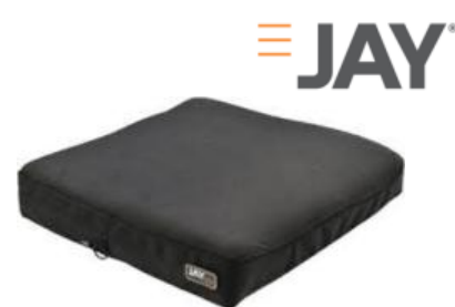
車いす用クッション