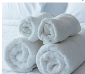
ベッドなどの 身の周りに