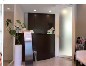
受付・待合室などの 除菌・消臭に